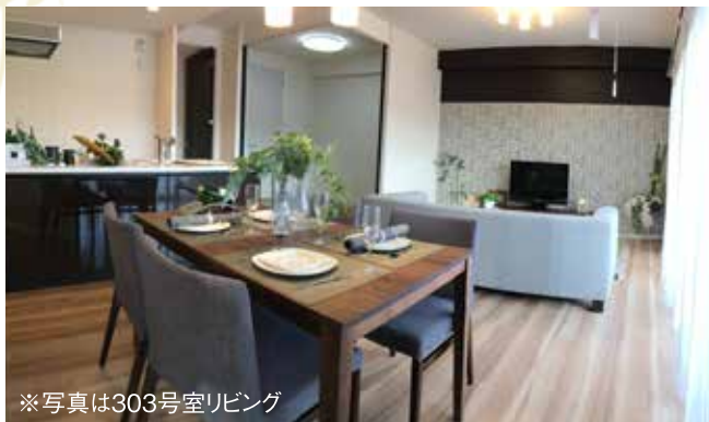
※写真は303号室リビング