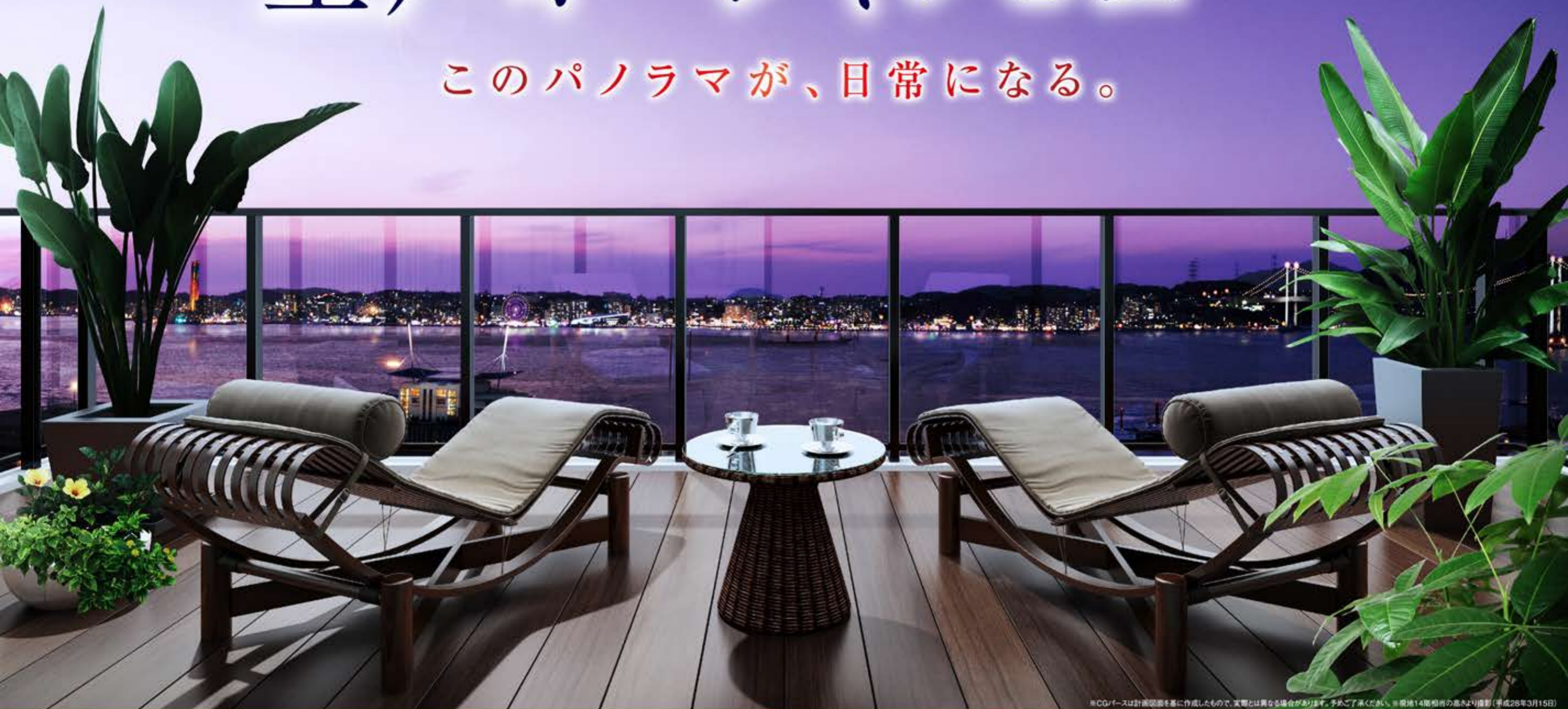
※CGは計画図面を基に作成したもので、実際とは異なる場合があります。予めご了承ください。※現地14階州の高さより撮影（平成28年3月15日）